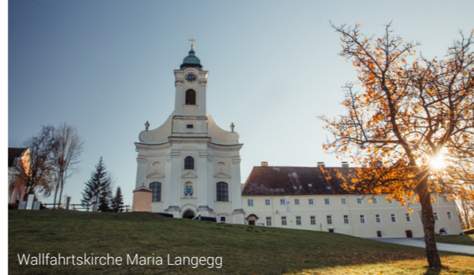
Wallfahrtskirche Maria Langegg